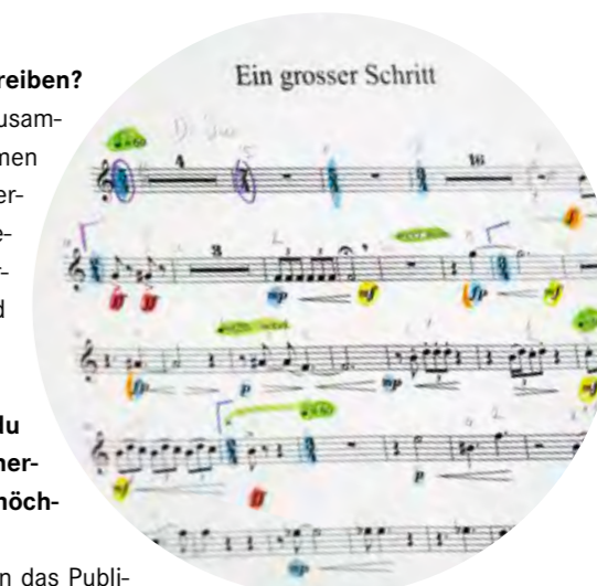
Noten «Ein grosser Schritt»

Ich war sehr überrascht, mit welcher Offenheit und Neugier die Mitglieder des JSO auf das Stück re-