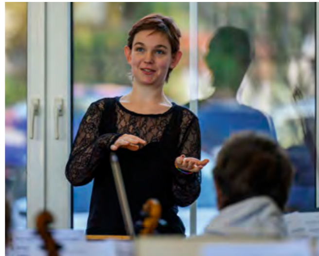
Probe von «Ein grosser Schritt» mit dem Orchester

Ich durfte wortwörtlich einen ganz neuen Blick auf die Musik werfen. Das Orchester von vorne zu sehen, ist schon eine andere Perspektive. Gerade das Dirigieren habe ich durch dieses Projekt schon etwas für mich entdeckt und möchte es in Zukunft auch intensivieren.