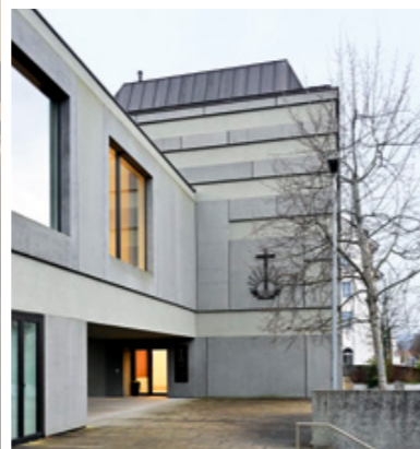
Die Neupostolische Kirche Aarau, ein toller Ort, um gemeinsam Gottesdienst zu feiern und zu musizieren.