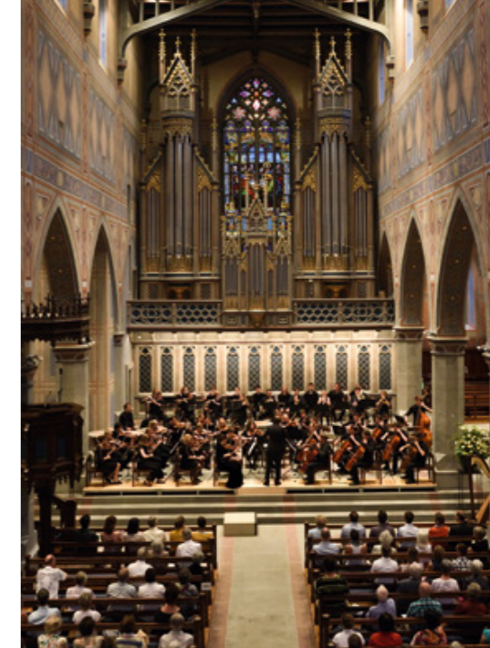
Münster Basel – JSO Konzert 2. Juni 2017: ein wahrlich mystischer Ort – die perfekte Bühne für schwermütige und melancholische Stücke.

ben es ihm aber die schwermütigen, melancholischen Stücke, wie zum Beispiel «Nimrod» von Edward Elgar oder der Klassiker «Phantom of the Opera». «Ganz grossartig fände ich es ja, wenn das JSO mal ein Requiem aufführen würde...»