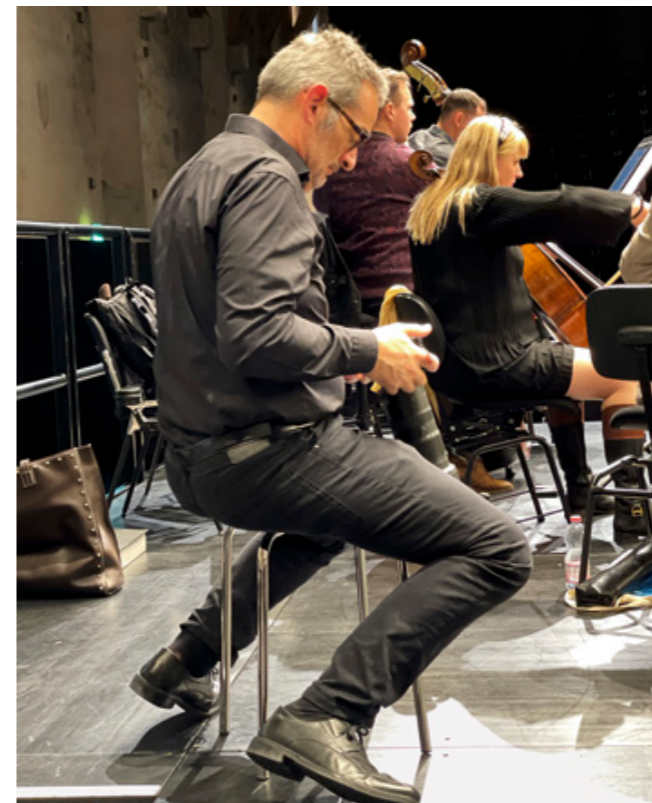
Konzentration wird nicht nur den Musiker:innen abverlangt, nur so entsteht einmaliges und professionelles Bildmaterial.

Fotografiere er im JSO, so bewundere er die Jugendlichen immer wieder aufs Neue, wenn sie mit so viel Elan ein Instrument spielen. Er selbst habe nie ein Instrument gelernt, als Junge sei das damals einfach nicht so «in» gewesen – dafür geniesse er heute einen sehr breiten Musikgeschmack, der von Rock bis Klassik und Oper reiche. Besonders angetan ha-