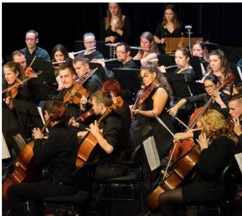
... und beim Musizieren