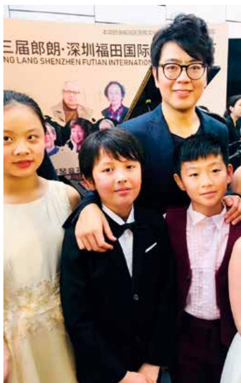
April 2019: Jason mit dem weltberühmten Pianisten Lang Lang anlässlich der Eröffnungsfeier von «2019 The 3rd Lang Lang International Piano Festival»