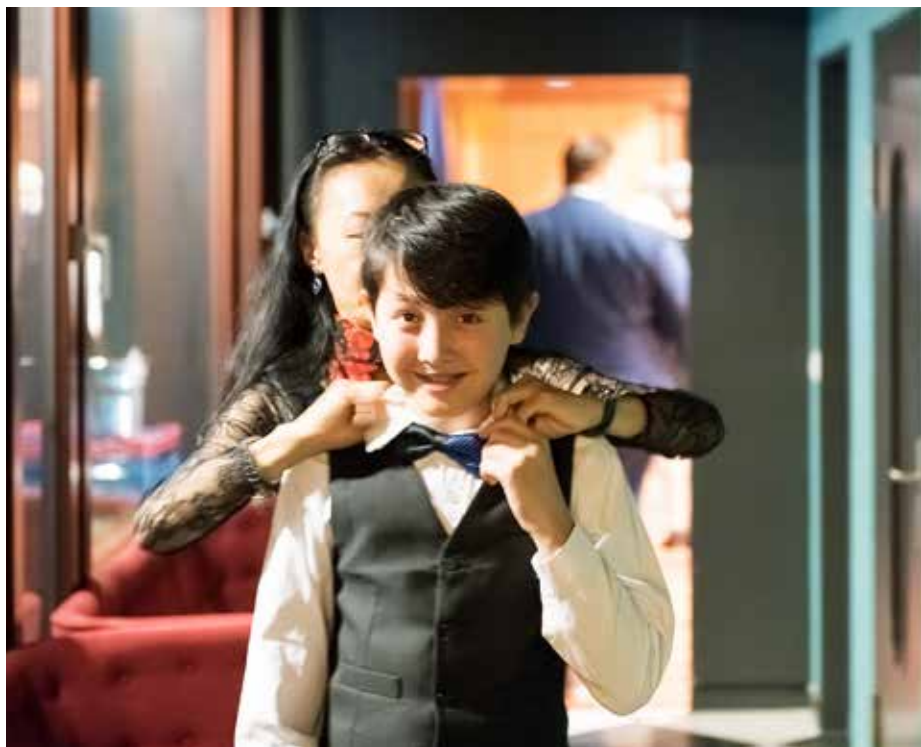
Jasons Mutter sorgt für Perfektion auch im Outfit!