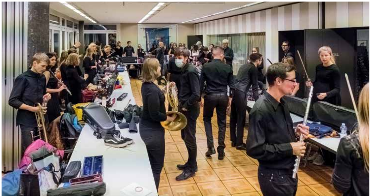
Letzte Vorbereitungen vor Konzertbeginn.