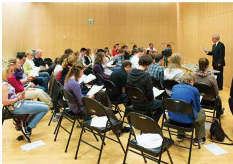
... im Gottesdienst