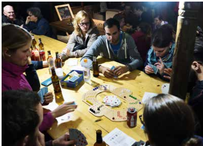
Gemeinschaft beim Spielen...