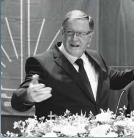
Bezirksapostel während dem Gottesdienst.