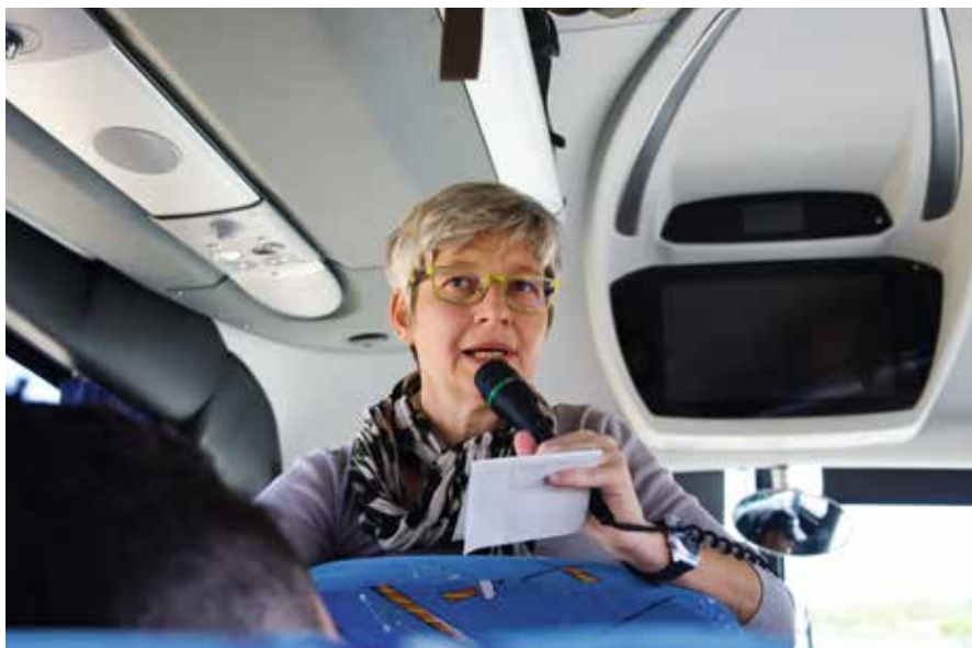
... und als Reiseleiterin in Kapstadt.

Ich freue mich darauf am Ende von hoffentlich noch vielen Konzerten in die strahlenden Augen der jungen Musikerinnen und Musiker und Konzertbesucher schauen zu dürfen. Und zu erleben welche Glücksmomente das Orchester der brennenden Herzen auslösen kann und dafür dankbar zu sein, dass ich zusammen mit dem Vorstandsteam und vielen Helferinnen und Helfern dazu einen Beitrag leisten darf. Das ist ein schönes Gefühl.