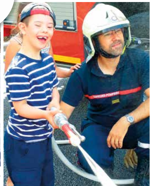
Strahlende Gesichter bei der Erfüllung der Herzenswünsche.

K inder und Jugendliche zu erfreuen, die auf der Schattenseite des Lebens sind, ist Teil der Mission des JSO. Nach 2015 engagierte sich das JSO im Rahmen des Konzerts im Schinzenhof zum zweiten Mal für die Stiftung Kinderhilfe Sternschnuppe. Zusätzlich unterstützt wurde diese Aktion durch die Gattinnen, der aus der ganzen Welt für eine Versammlung angereisten Bezirksaposteln, indem sie «Weihnachtsguetzli» backten, welche zu Gunsten der Stiftung verkauft wurden.