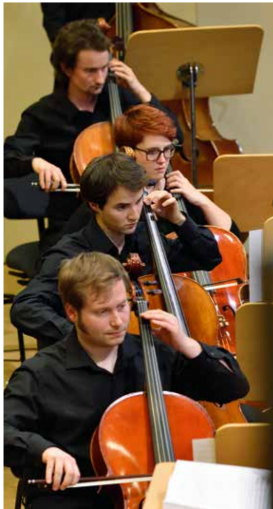
Harmonik (Harmonie) ist ein umfassender Begriff aus der Musiktheorie und -praxis. Er steht für den gleichzeitigen Zusammenklang der Töne.

Inspiziert durch das NRW-Konzert vom Mai 2011 wurde zwei Jahre später das Jugend-Sinfonieorchester NAK Schweiz gegründet. Seither verbindet die beiden Orchester eine enge Freundschaft. Im November 2015 konzertierte unser JSO in der Historischen Stadthalle Wuppertal – gemeinsam mit dem Jugend-Konzertchor aus Nordrhein-Westfalen.