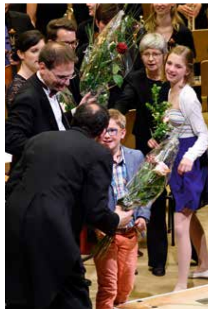
Die kommenden Talente gratulieren ihren Vorbildern.