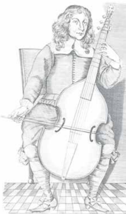
Gambenspieler Christopher Simpson. Wichtige Unterschiede zum Cello: Sechs Saiten, kein Stachel, Bogen im Untergriff gehalten, Bündel, hängende Schultern, kurzes Griffbrett.

Normalerweise werden die Saiten mit den Haaren des Bogens gestrichen ( coll'arco ). Manchmal werden sie mit den Fingern gezupft ( pizzicato ), können aber in seltenen Fällen auch mit der Holzstange des Bogens gestrichen oder geschlagen ( col legno ) werden. Die Saiten bestehen nicht aus einem Stück, sondern bestehen aus einem Kern, der mit Metalldraht umspinnen ist. Der Kern bestand traditionell aus Schafsdarm. Heute werden jedoch vorwiegend Stahl und Kunststoff eingesetzt. Zart besaitet ist das Cello nicht, die Belastung des Stegs beträgt mehrere «Kilogramm». Je nach Druck, Geschwindigkeit