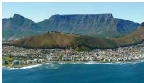
KONZERTREISE – Südafrika