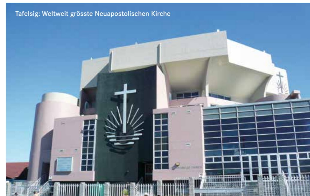
Tafelsig: Weltweit grösste Neuapostolischen Kirche

Vorgesehen ist zudem ein Gottesdienstbesuch in Tafelsig, in der weltweit grössten Neuapostolischen Kirche.