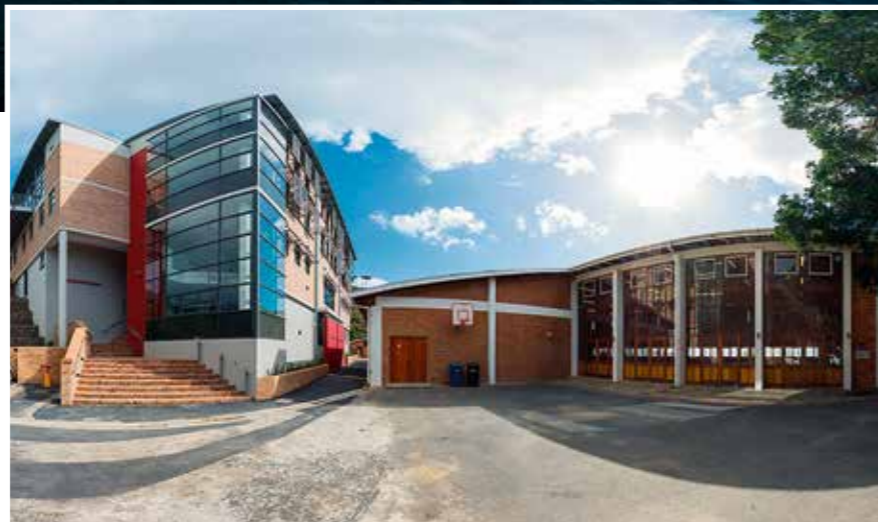
Deutsche Schule, Kapstadt

Am 2. Oktober 2016 beginnt für das Jugend-Sinfieorchester eine zweiwöchige Konzertreise nach Südafrika mit Konzerten in der Deutschen Schule in Kapstadt und im berühmten Musikauditorium in Silvertown. In Kapstadt wird das Orchester zusammen mit einem lokalen Jugendchor, zusammengesetzt aus über 100 lokalen Sängerinnen und Sänger, an drei Proben auf dieses Highlight vorbereitet.