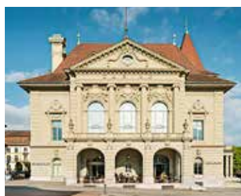
KONZERT Casino Bern