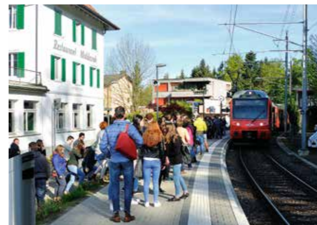
Fahrt zum Brunch auf den Uetliberg