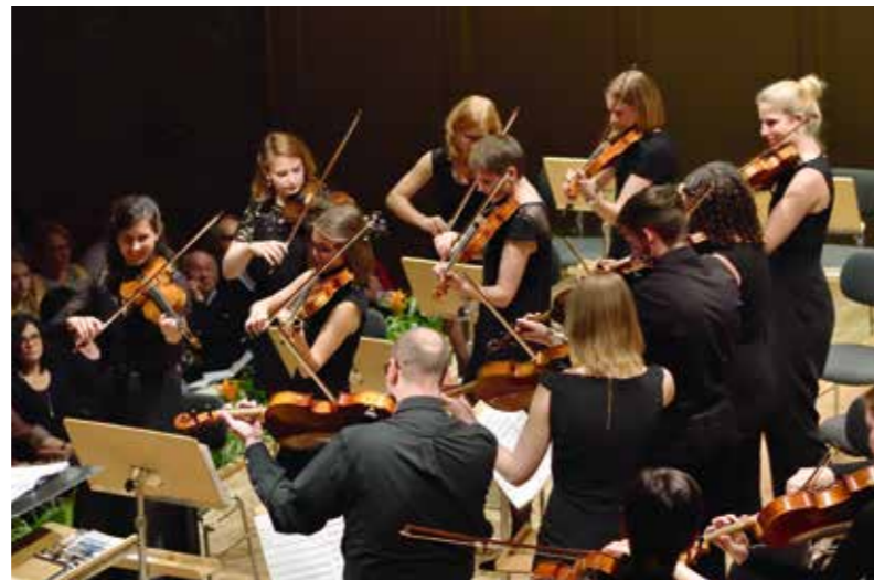
«The Lord of the Dance», stehend und in atemberaubenden Tempo!