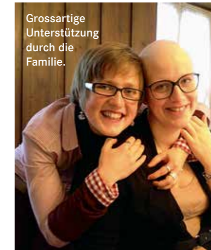
Grossartige Unterstützung durch die Familie.

Zuerst eine gross Leere, gefolgt von einem Schock und von Unverständnis. Zum Glück konnte ich diesen Zustand schnell umwandeln in die Überzeugung, dass das doch noch nicht das Ende sein kann. Von diesem Moment an beherrschten Hoffnung und Vertrauen in die Schulmedizin meine Gedanken.