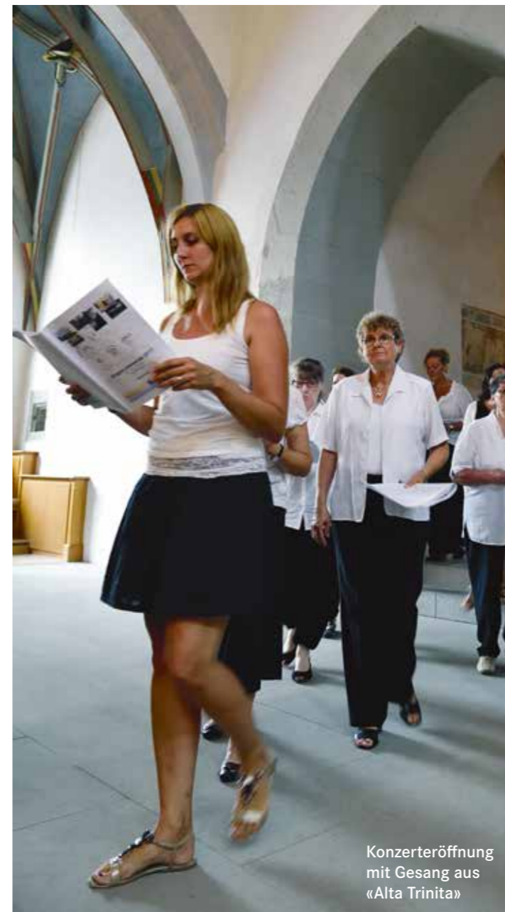
Konserteröffnung mit Gesang aus «Alta Trinita»