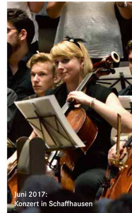
Juni 2017: Konzert in Schaffhausen

Die Wertvorstellungen sind plötzlich ganz anders. Solidarität und echte Freundschaften sind noch wichtiger geworden. Der Alltag veränderte sich rapide. So musste ich meine berufliche Tätigkeit und teilweise auch Sportarten aufgeben. Zudem litt ich sehr unter dem Haarverlust. Ich habe mich dafür eher kreativ entwickelt. Seit neuestem gibt es auch eine Bucketlist in meinem Leben, die ich fleissig am Abarbeiten bin. Mein Beruf ist eher mathematisch orientiert weshalb ich mich plötzlich im medizinischen Feld zurecht finden musste, zwei verschiedene Welten