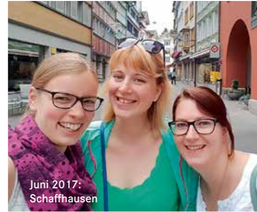
Juni 2017: Schaffhausen

ren in Schaffhausen hatte eine sehr beruhigende schon fast therapeutische Wirkung auf mich. Ich danke allen von ganzem Herzen.