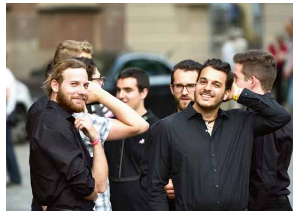
Freude und Erleichterung nach dem erfolgreichen Konzert