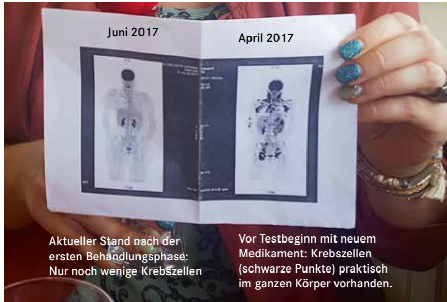
Aktueller Stand nach der ersten Behandlungsphase: Nur noch wenige Krebszellen