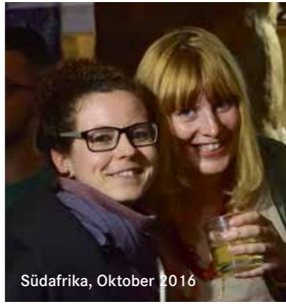
Südafrika, Oktober 2016

Zweimal pro Woche werde ich im USZ getestet, um den Verlauf des Immunsystems aufbaus zu überprüfen. Bis ich selbst wieder stark genug bin werde ich von einem Fahrdienst chauffiert.