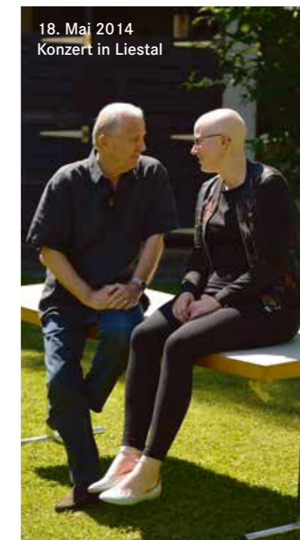
18. Mai 2014 Konzert in Liestal

Nach weiteren Untersuchungen im Balgrist erhielt ich dann im September 2013 die niederschmetternde Diagnose: Lymphdrüsenkrebs.