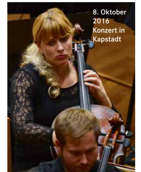
8. Oktober 2016 Konzert in Kapstadt