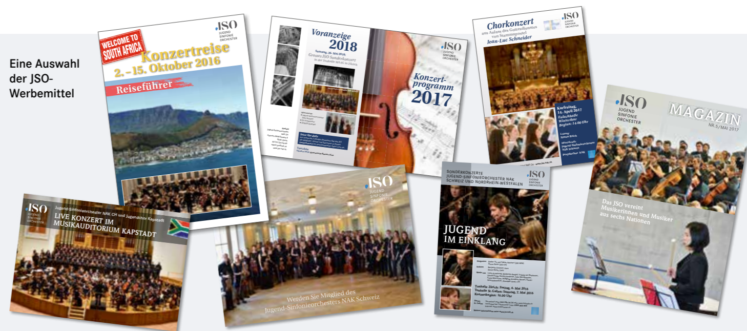
Eine Auswahl der JSO-Werbemittel