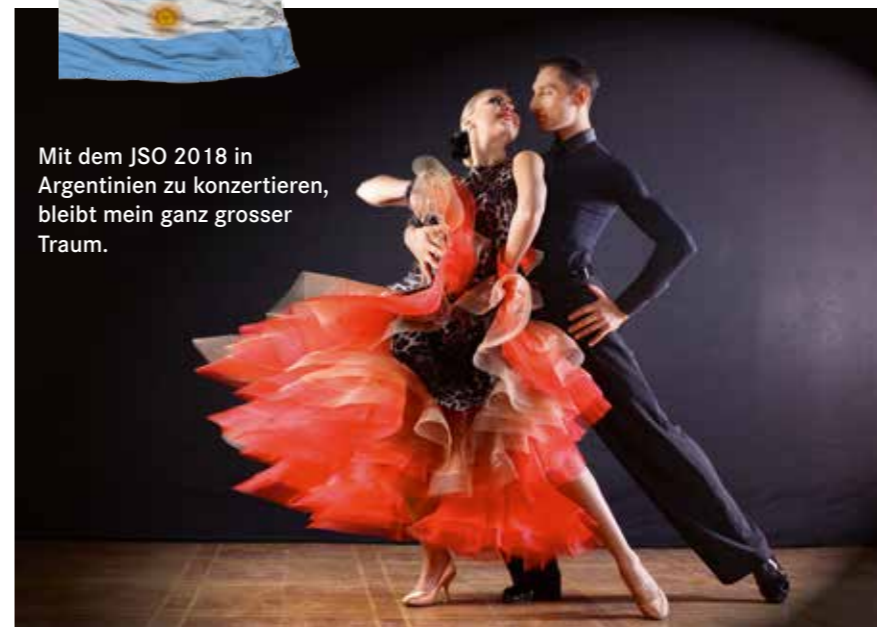
Mit dem JSO 2018 in Argentinien zu konzertieren, bleibt mein ganz grosser Traum.