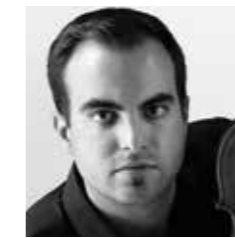
Samuel Hauri, Redazione Rivista JSO