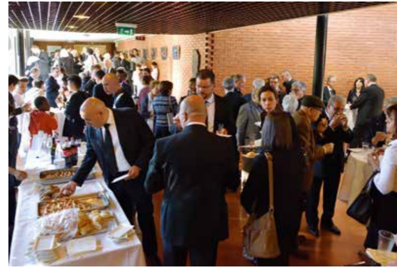
Preparazione del concerto e aperitivo per gli ospiti