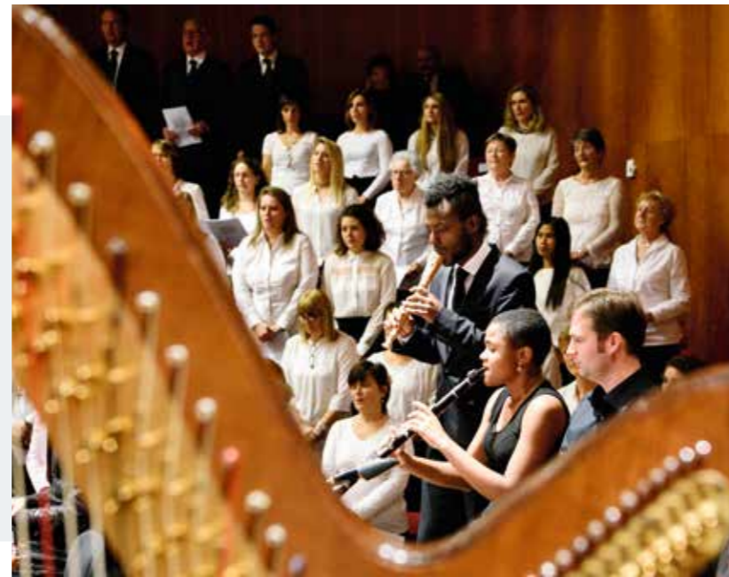
Abbellimento musicale del servizio divino di festa