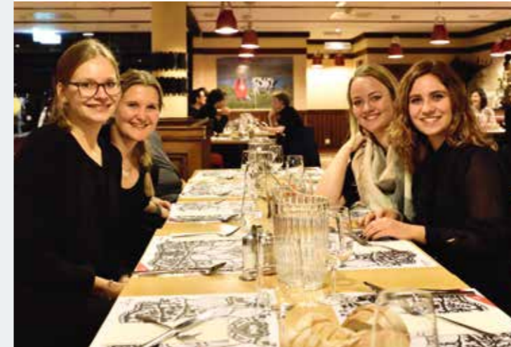
Sentimenti di gioia dopo l'ottima riuscita del concerto