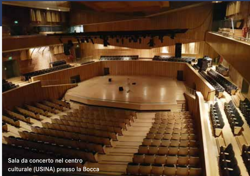
Sala da concerto nel centro culturale (USINA) presso la Bocca