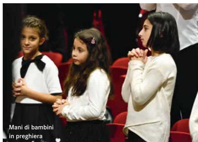
Mani di bambini in preghiera