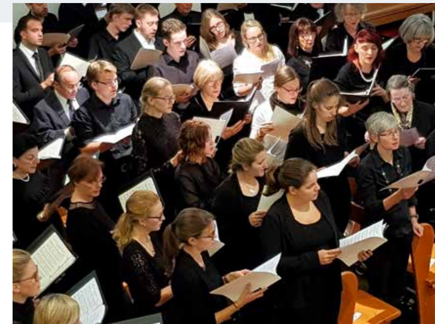
Collaborazione musicale ad abbellimento del servizio divino di festa