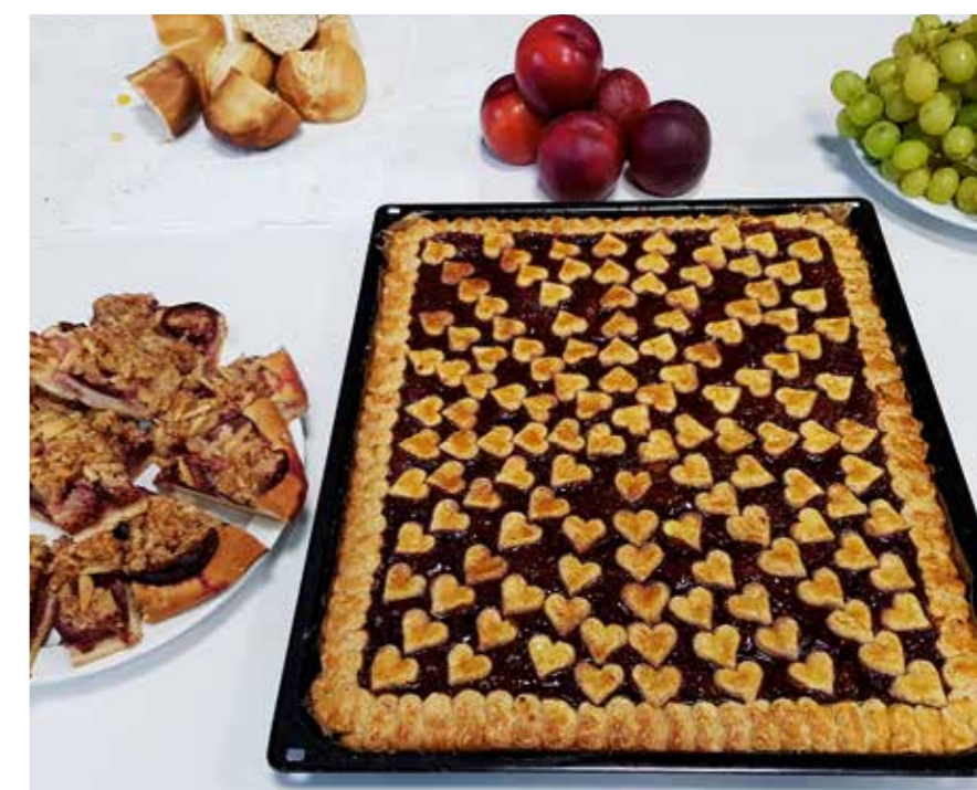
La nostra pasticceria, fatta in casa e di tutto cuore