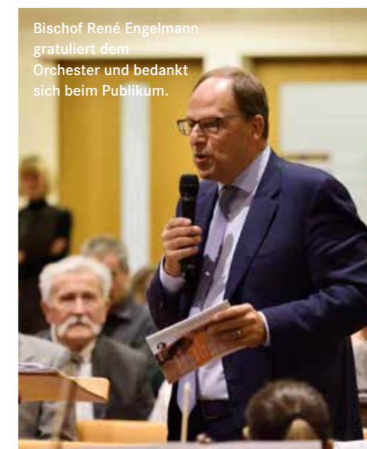
Bischof René Engelmann gratuliert dem Orchester und bedankt sich beim Publikum.