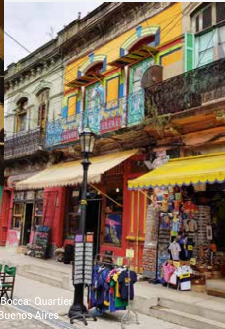
La Bocca: Quartier in Buenos Aires