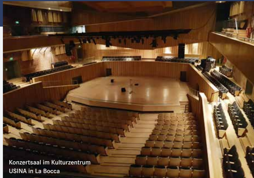
Konzertsaal im Kulturzentrum USINA in La Bocca