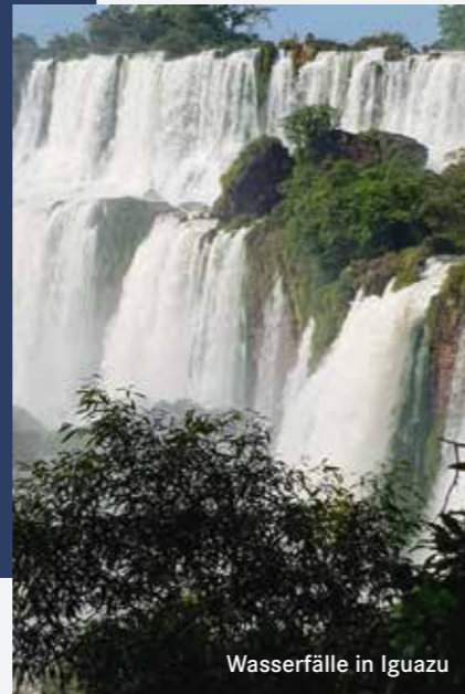
Wasserfälle in Iguazu

– Nach dem Konzert wird die Konzertreise mit einem Ausflug zu den weltberühmten Wasserfällen in IGUAZU abgeschlossen.