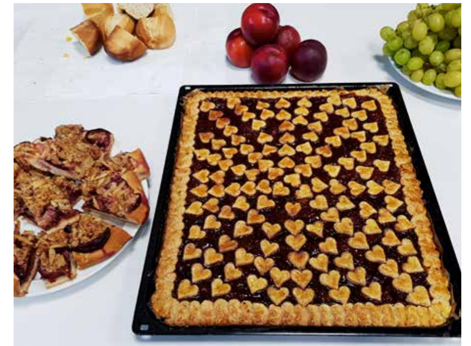
Eigenkreationen mit Herz gebacken.