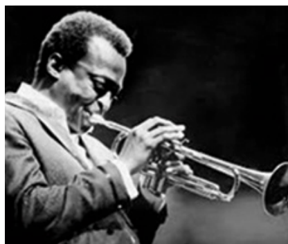
Miles Davis: «Do not fear mistakes. There are none.»

Ich versuche dann die Hektik zu vergessen, mich zu entspannen und mich so in die Musik hineinzusetzen.