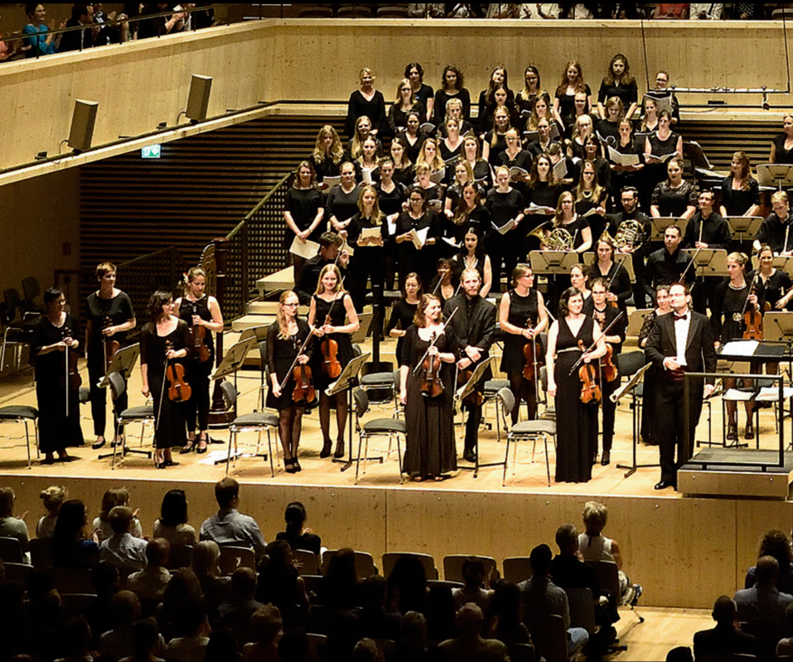
Jugend-Sinfonieorchester NAK Schweiz