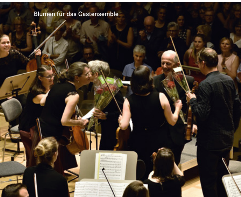
Blumen für das Gastensemble