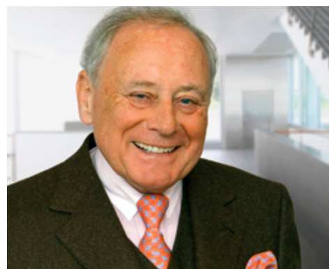
Prof. Dr. h. c. mult. Reinhold Würth Vorsitzender des Stiftungsaufsichtsrats der Würth-Gruppe